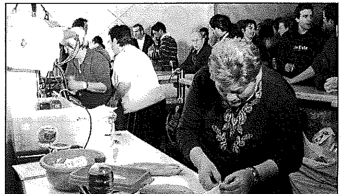
L'escudellada, un dels actes tradicionals.- Al llarg de dissabte al vespre es va fer l'escudellada i es van servir racions fins que es van exhaurir les existències. Aquest és un dels actes de referència de la Festa Major de la Batllòria (L'ADBM)