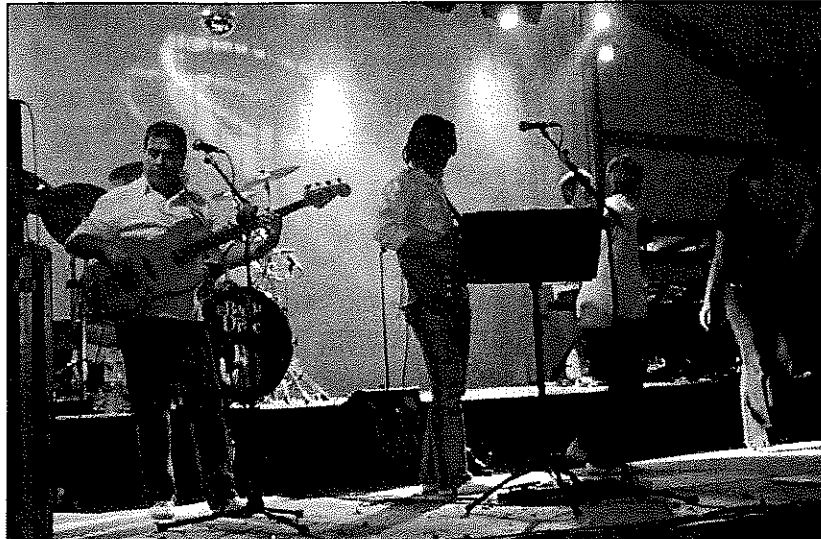
El concert de la Banda del Drac va ser seguit per un nombros públic

Tant les dues activitats citades, com els balls de nit, com el de la Banda del Drac, les cercaviles, les exposicions i fins i tot les nombroses atrac-