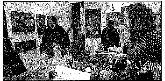
La rectoria, plena d'obres i visitants el dissabte passat