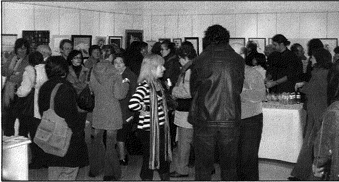
La inauguració de l'Exposició de Pintura de l'Acadèmia Kaso va ser tot un èxit (AdBM)

L'exposició acull obres de tot tipus d'estil i de tot nivell,