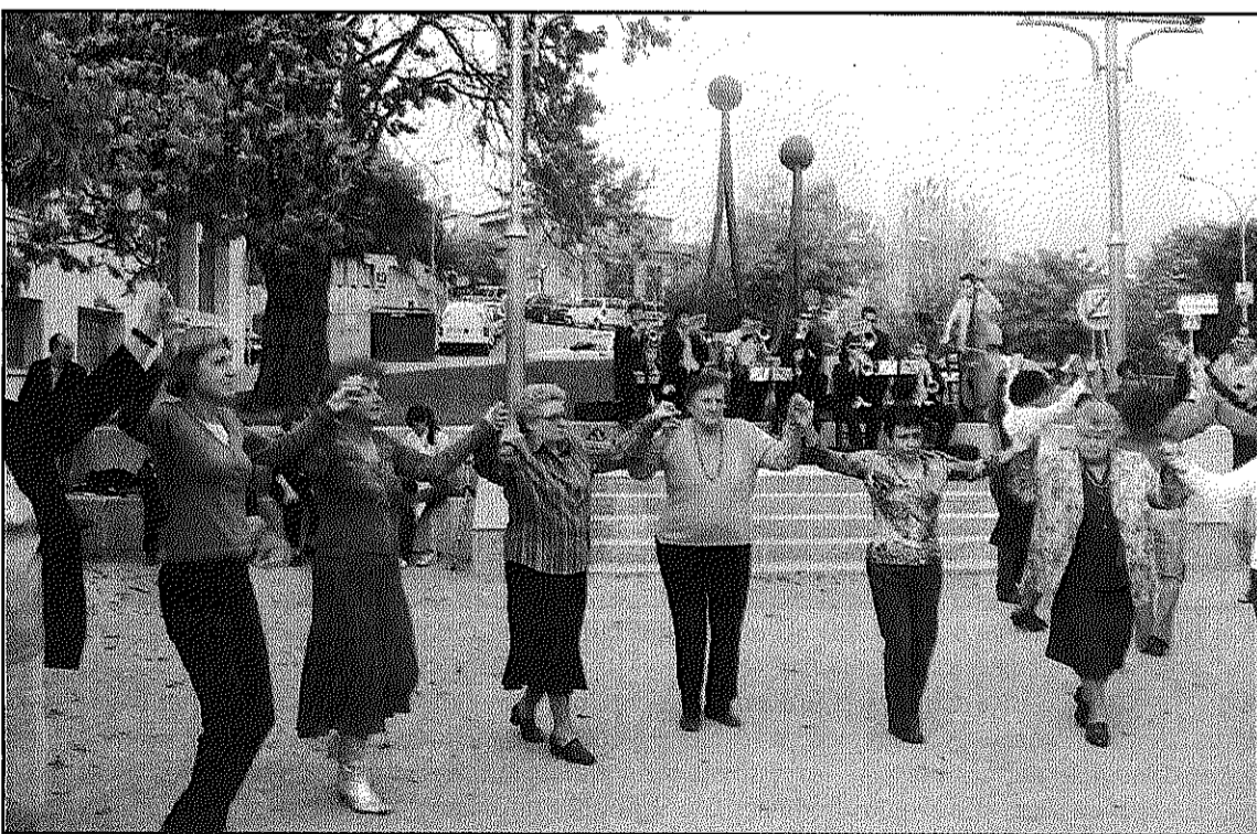
Una de les ballades de sardanes convocades per l'Agrupació Sardanista Baix Montseny (L'AdBM)

La Cobla Jovenívola de Sabadell és una de les més importants dins el panorama sardanístic català. Fundada al 1976, precisament al mateix any que l'Agrupació Sardanista Baix Montseny, i amb més de 30 anys d'expe-