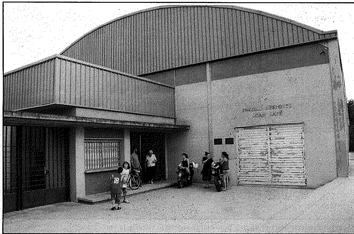
Els bombers van haver de comprovar les plaques del sostre del poliesportiu a causa del vent (L'AdBM)

Al Baix Montseny, el municipi que va registrar un major nombre d'intervencions per part del Cos de Bombers va ser Sant Antoni de Vilamajor, amb tres actuacions al municipi al llarg de diumenge. La més significativa va ser a la pista poliesportiva, on els efectius van haver de comprovar