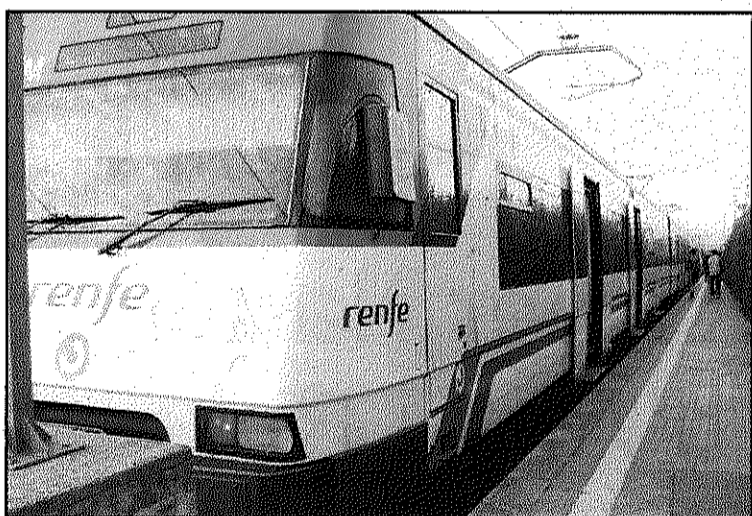
Ahí, dijous, un accident va afectar de nou la línia C-2 (L'AdBM)

REDACCIÓ. Sant Celoni La desconfiança en el servei de tren de Renfe ha fet que la companyia hagi perdut un 15 per cent dels seus usuaris a les línies C-10 i C-2, de Vilanova fins a Massanes pel Baix Montseny, des del passat 20 d'octubre, quan a causa d'un incident provocat per les obres del TAV a Bellvitge es va interrompre el servei en ambdues línies habilitant un sistema alternatiu en autocar.