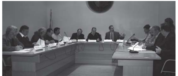
El conveni es va signar a l'Ajuntament de Sant Celoni