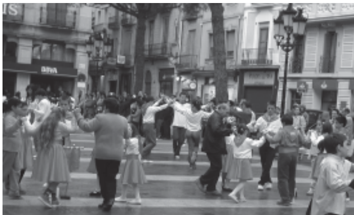
Any 2002. Trobada infantil a la plaça de la Vila