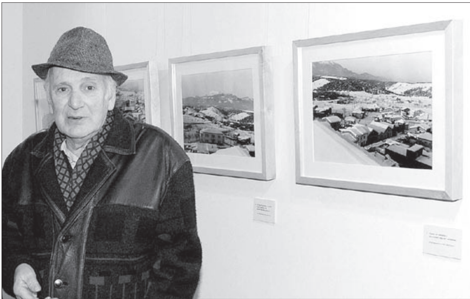
El fotògraf de Sant Celoni Josep Maria Cortina exposa desenes de fotografies que rememoren, 45 anys després, una nevada insòlita