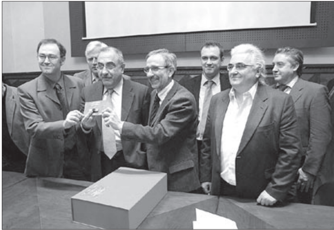
Els alcaldes de diversos municipis i els diputats de Medi Ambient de Barcelona i Girona van entregar el pla a Nadal

El document contempla la creació de vuit zones de màxima protecció: turó de l'Home i les Agudes (324 hectàrees), Vallforners (397ha), torrent del Clot (18ha), obaga de Collfornic (106ha), Matagalls i Sant Marçal (1.116ha), turó de Morou i Santa Helena (295ha), turó dels Marcolers (9ha) i Puigdrau