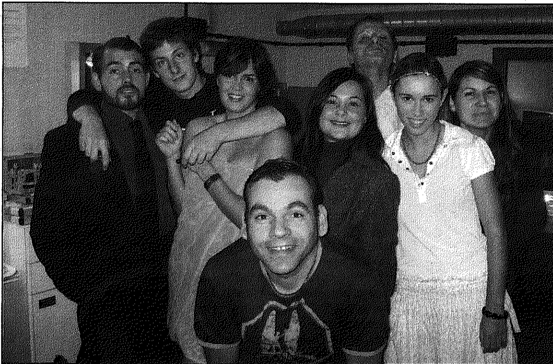
El grup Catarsi tornarà a interpretar "Torna-la a tocar, Sam", de Woody Allen (L'ADBM)

També diumenge a la mateixa hora a Llinars, en aquest cas a Can Mas Bagà, l'Associació Músics de Llinars segueix amb el cicle dedicat a "Les Luthiers", el famós grup argentí. En aques-