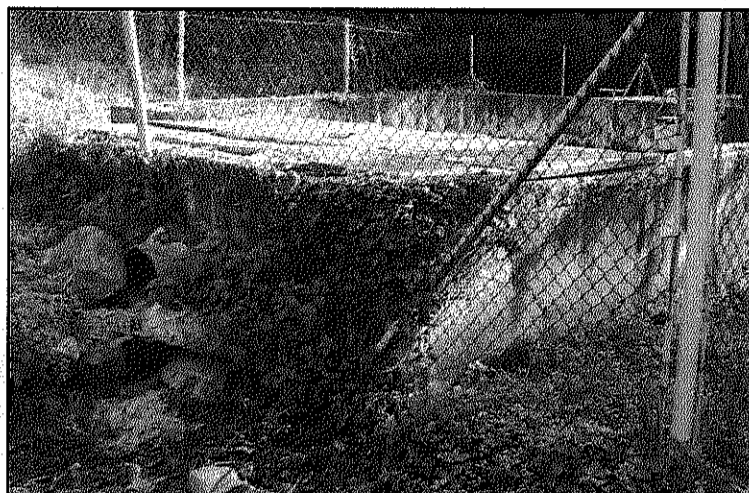
Una imatge de l'estat de la depuradora de la Costa

REDACCIÓ. Fogars de Montclús Malgrat l'anunci dels treballs per a la construcció d'una nova depuradora al nucli de Pertegàs, a Fogars de Montclús, a finals del passat mes de setembre, les dues depuradores del municipi, que fa anys que estan en desús, no han deixat d'abocar aigües residuals a la riera del Rifé, que desemboca a la riera del Pertegàs, o a la zona boscosa de la Costa de