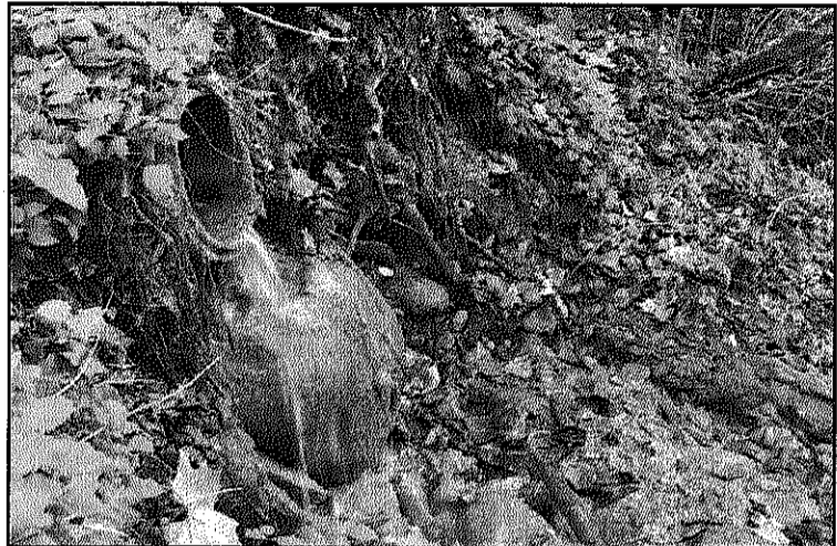
El col·lector del Pertegàs vessa residus a la riera Rifé (L'AdBM)

Les depuradores del Pertegàs i de la Costa fa anys que aboquen aigües residuals a la riera i el bosc