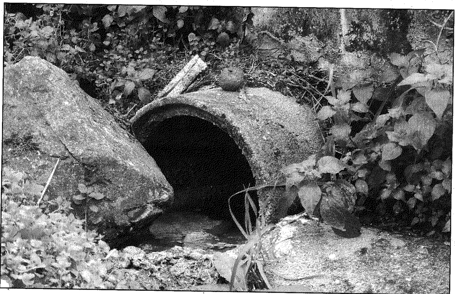
Una conducció envia les aigües sense tractar directament al Partegàs, al bell mig del Parc Natural del Montseny (L'AdBM)

Enrenou a Arbúcies per les obres de la llar d'infants a la Pietat (Pàgina 15)