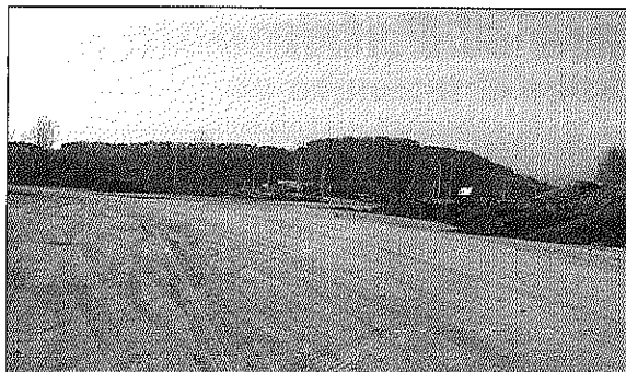
El terreno donde irá el parque está ubicado en un privilegiado nudo de comunicaciones.

posibilidades a las infraestructuras del cuerpo de Sant Celoni, no solamente por disponer del doble de espacio con lo que todo ello supone, sino porque también podría ser una realidad una base de helicópteros que ya se quería hacer en la ubicación actual, pe-