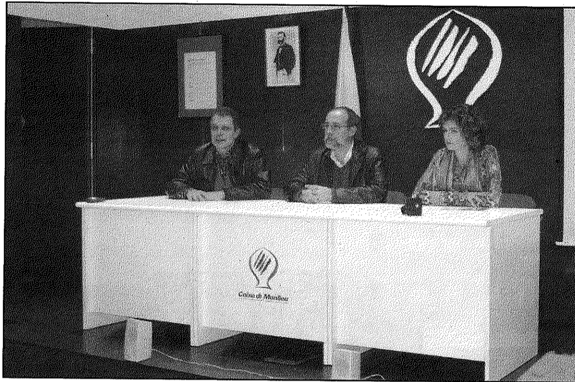
Una imatge de l'acte de presentació del dissabte passat a la Sala de Caixa Manlleu (L'AdBM)

Abans de la presentació del projecte SIMAP es va fer a la plaça de la Vila de Sant Celoni la inauguració del nou vehicle de transport adaptat de la Creu Roja que ha estat patrocinat totalment per empreses del Baix Montseny. Es tracta d'un vehicle de vuit places, dues de les quals s'han habilitat per poder portar persones amb cadira de rodes.