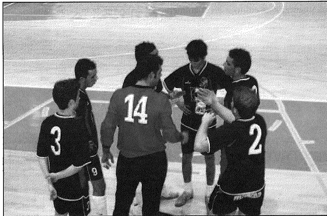
El CFS Arbúcies necessita recuperar-se amb la victòria

El FS Sant Celoni està aconseguint una bona línia de joc als darrers partits