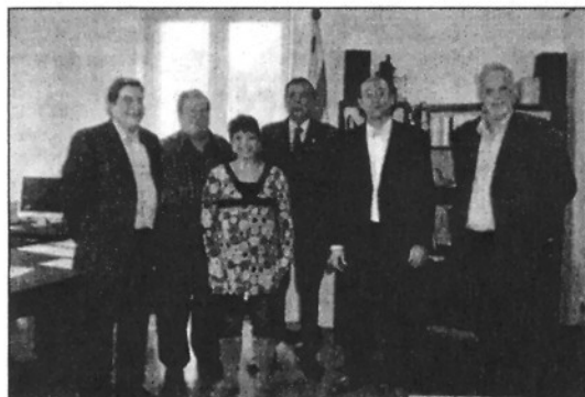
La presentació oficial del viatge divendres passat (L'ADBM)

REDACCIÓ. Vallgorguina Divendres de la setmana passada es va presentar oficialment, el viatge a Costa Rica que estan realitzant quatre colles geganteres de Catalunya, en el que participa la de Vallgorguina, a més de les colles de La Llacuna, Pobolada i Riudoms.