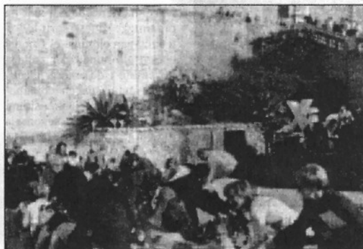
Una actuació de la companyia Xip Xap, present a Vilalba (L'ADBM)

REDACCIÓ. Vilalba Sasserra La Festa de Tardor arriba aquest cap de setmana a Vilalba Sasserra amb nombroses activitats adreçades a tot tipus de públic. Dissabte la Festa, que compta amb el suport de Viu el parc, anirà destinada eminentment a la mainada, amb un berenar, a les 5 de la tarda, per als més petits, i l'espectacle infantil de la companyia Xip Xap que presentarà l'obra d'animació 'Descontes' al Centre Cívic del municipi.