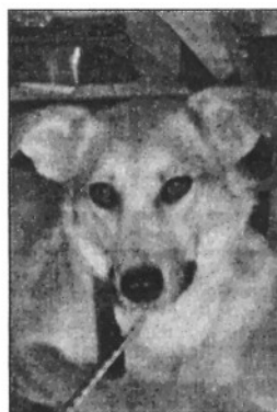
Dos dels gossos de Vallgorguina que esperen ser adoptats

Des de l'Ajuntament també s'han ofert a facilitar els tràmits i la documentació necessària per a poder efectuar l'adopció d'aquests animals de companyia i s'ha compromès a subvencionar, en part, a