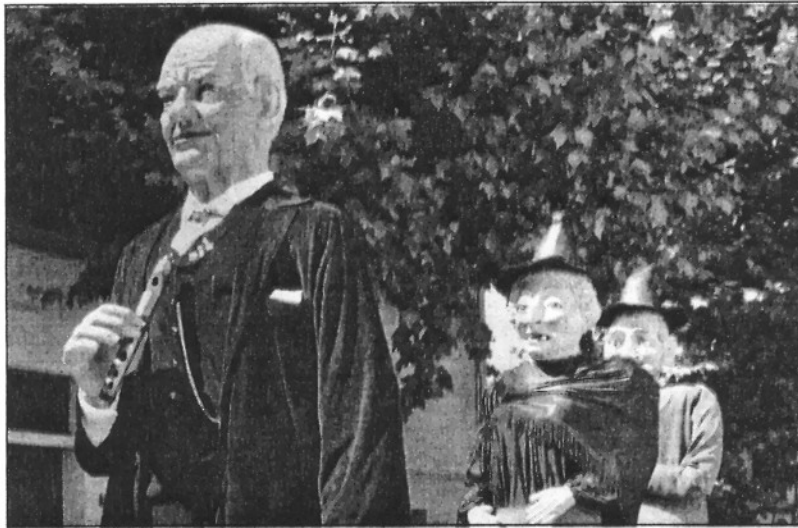
Els geganters de Vallgorguina es desplacen el cap de setmana a Costa Rica amb el CIAG