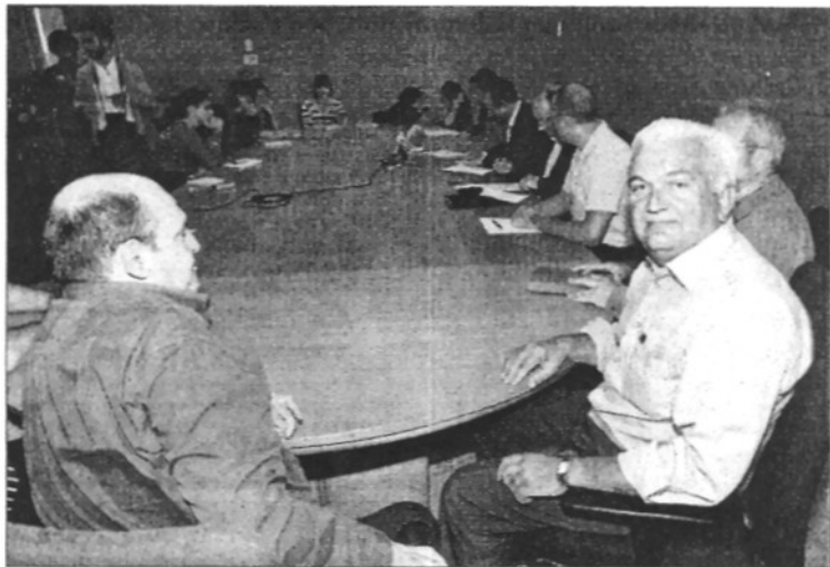
En primer terme, dos membres del col·lectiu de taxistes mentre els tres alcaldes signaven el conveni

L'acord permetrà unificar les flotes de taxi de les tres poblacions que, juntes, sumen 35 vehicles i que, a partir d'ara, seran tots de color gris. Els taxis, siguin de la població que siguin, podran treballar a qualsevol dels tres pobles. La centralita