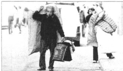
Dos veïns dels habitatges afectats del carrer Azcárraga traslladaven ahir les seves pertinences

El carrer Azcárraga de València intentava tornar a la normalitat ahir al matí després de l'ensurt de la forta explosió que van viure dividendres. Molts veïns feien cua davant d'una unitat mòbil municipal per denunciar els desperfectes dels habitatges i dels establiments comercials. Paral·lelament, els agents de la policia local, els