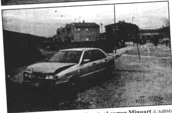
A l'esquerra, en la imatge de l'Ajuntament, els cotxes al pàrquing de Mossos. A la dreta, abandonats al carrer Minuart (L'ADBM)

REDACCIÓ. Sant Celoni Veïns de les Torres han denunciat a l'Actualitat que els Mossos d'Esquadra de Sant Celoni abandonen vehicles que han requisat pels carrers del barri. En concret, els veïns apunten com a exemple dos turisme