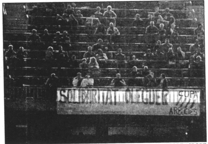
JOAN MONTFORT / SPORT