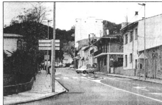
La carretera de Viladrau és un dels vials més afectats

L'Entesa d'Arbúcies no vol camions pesants pel mig del poble (Pàgina 10)