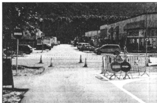
Dilluns es va tallar el carrer tant d'entrada com de sortida

Queixes a Sant Celoni pel tall del carrer València amb la C-35 (Pàgina 7)