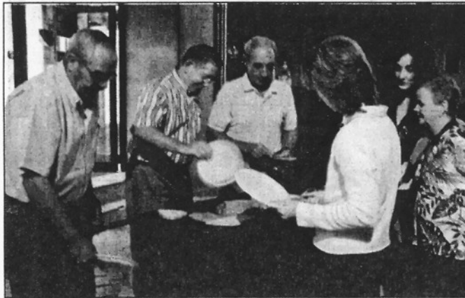
Els veïns van poder coure la carn als brasers dels dos extrems del carrer

fiesta ja que va romandre oberta des de la celebració de rosari en honor a Santa Tecla.