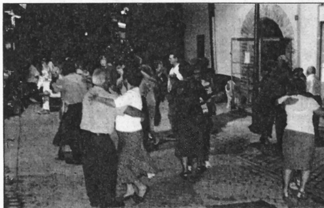
El ball de nit va marcar el final d'una festa que va durar fins a la matinada (L'ADBM)