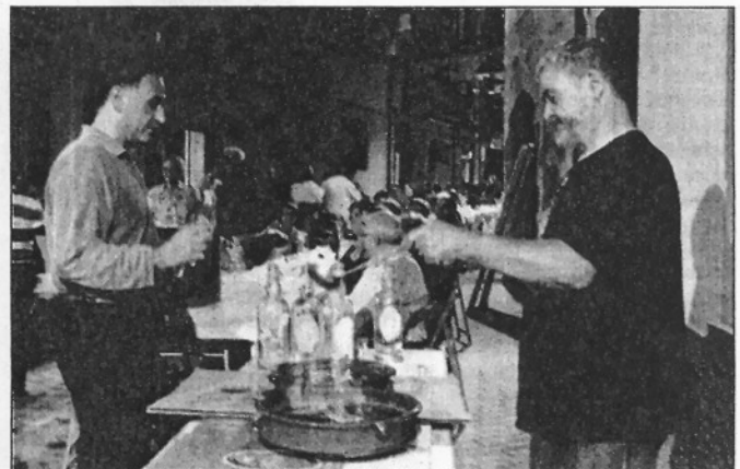
Els assistents també van poder degustar, durant el ball, el rom cremat (L'ADBM)