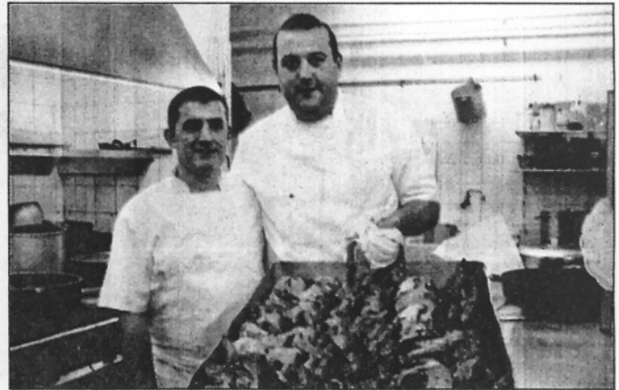
Els Avets va contribuir al sopar popular oferint racions de pollastre rostit (L'ADBM)