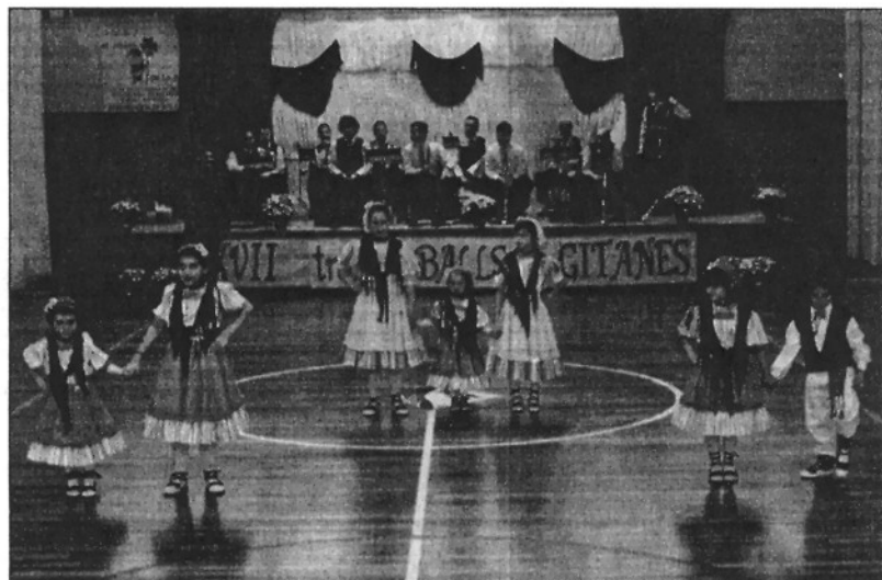
Una imatge de la XVII Trobada de Bells de Gitanes celebrada a Llinars del Vallès

Les primeres manifestacions documentades d'aquest ball es remunten, a Llinars, a principis del segle XIX i la seva presència com a dansa de caire popular s'ha mantingut fins als nostres dies. El ball, que pren especial relleu al Baix Montseny, es conserva encara, a més de Llinars, a municipis com Gualba, Sant Celoni o Sant Esteve de Palautordera, que compten amb un nombre considerable de balladors i amb un seguiment