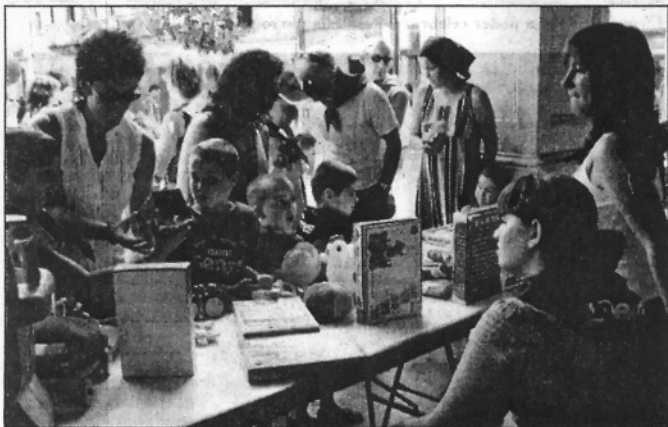
El primer mercat de l'intercanvi propicia el canvi de més de 200 jocs (L'AMBIM)