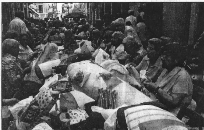
Les puntaires van mostrar els seus treballs al carrer Major de Sant Celoni (L'AMBIM)

canvi de més de 200 jocs i juguines promovent un model alternatiu al consumisme.