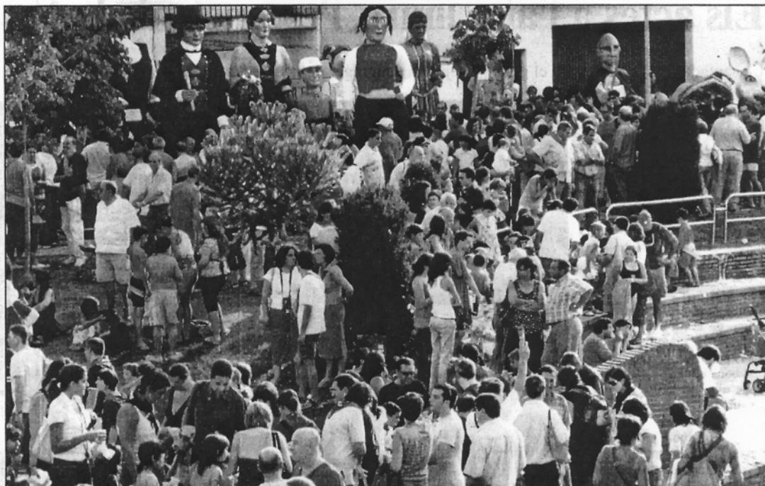
La plantada de gegants, coincidint amb la festa de l'escuma, va atreure centenars de curiosos a la plaça de la biblioteca

L'ambient al centre de Sant Celoni es va viure de diverses maneres. Una d'elles va venir