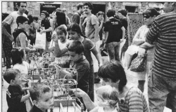
La plaça de la Vila es va omplir de jocs gegants al llarg del matí de dissabte (L'AMBIM)