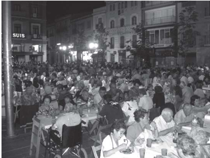
Sopar popular de l'any 2006 a la plaça de la Vila

Com cada any per la festa Major podrem sortir al carrer no només a ballar, cantar, participar... també a menjar!