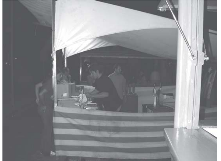
Les entitats es fan càrrec de les barraques

La força de les entitats es notarà d'una manera especial a l'espai Festa i zona de barraques. Aquest any són 10 les barraques que trobarem amb servei de bar: Casal Popular i Independentista Quico Sabaté, Club Billar la Bolera, Club de Rol Alastor, Club Patí Sant Celoni (hoquei), Club Patí Sant Celoni (patinatge), Colla Bastonera del Casal Quico Sabaté, Colla de Diables, Joventut Nacionalista de Catalunya i Trup de Nassos. A més, hi haurà una Barraca Mòbil que donarà servei de bar a llocs on es realitzen actes com Tret de sortida del Corremonts, Exhibició de Ball, Ball am Xazzar, Danses del món, L'estirada de corda, Ball country, La rucada i Veredictes Corremonts. L'entitat que portarà aquesta barraca mòbil serà Trup de Nassos. Assenyalar també que la CUP serà l'entitat que, com els darrers anys, s'encarregarà de la barraca on es compren els gots.