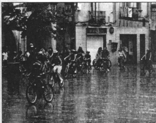
L'edició de l'any passat de la passejada de bicicletes

Els actes infantils han estat organitzats per Xarxa Sant Celoni, l'Agrupament Escolta Erol i la Colla Gegantera.