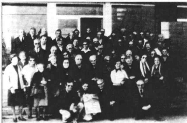
Excursió a la fàbrica Xocolates Torres d'Olot

No quedava limitada únicament als viatges l'activitat de l'Esplai sinó que