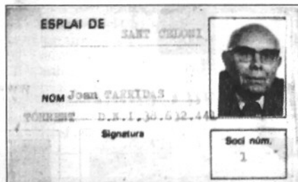
Primer carnet de soci de l'Esplai de Sant Celoni