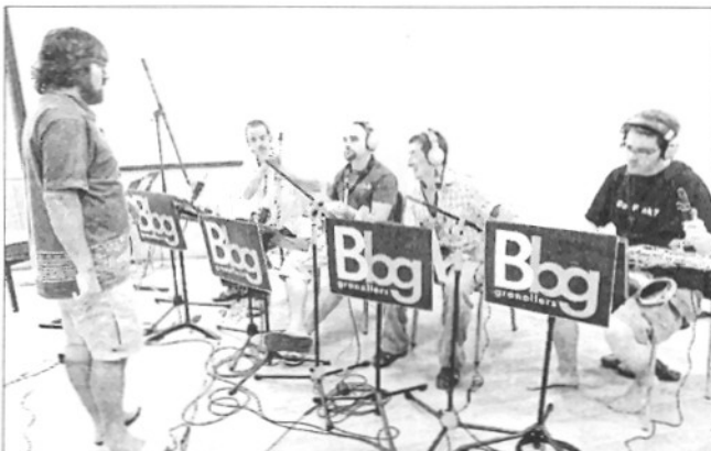
La Big Band de Granollers, durant la gravació de diumenge a l'escola de música Josep M. Ruera