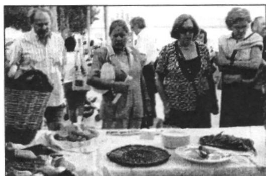
Una de les parades de la Mostra que es va fer diumenge

Llinars aplega 2.500 persones en la segona Mostra gastronòmica (Pàgina 22)