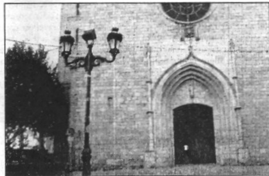
Les misses es van haver de traslladar per obres al CEIP (L'AdBM)

Les eucaristies de Breda deixen el gimnàs i tornen al temple (Pàgina 13)