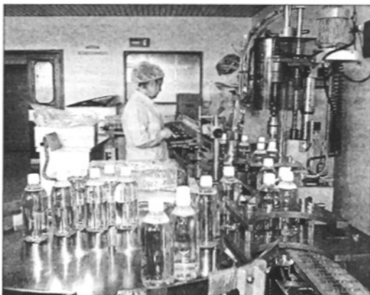
Laboratorios Inibsa, amb seu a Llità de Vall

La divisió hospitalària ha aportat un terç de la facturació i es manté com l'àrea amb més pes en la xifra de negoci de la companyia. La divisió odontològica representa un 28% de la facturació, la farmacèutica un 25% i la internacional un 13%. Amb tot, per àrees terapèutiques, les