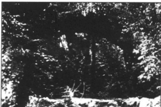
L'Entesa considera que malmetrà l'entorn del pont romànic (L'ABIM)

Vallgorguina obre un nou espai de lleure nocturn per als joves (Pàgina 14)