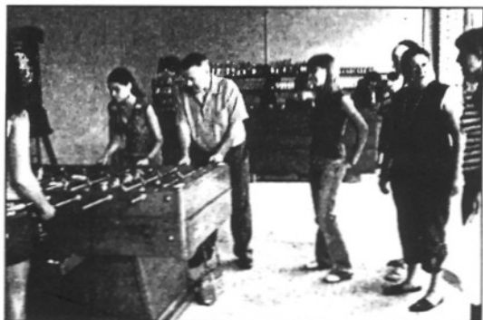
El Ple va donar la concessió a la Fundació Pere Tarrés (L'ABIM)