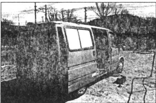
Fil de coure comissat pels Mossos (MOSSOS DESQUADRA)

REDACCIÓ Sant Celoni Els Mossos d'Esquadra han contabilitzat que al llarg d'aquest any 2007 s'ha procedit a realitzar fins a 310 detencions per robatoris i furt de cable de coure, un material que ha estat sostret al llarg de l'any a diversos municipis i empreses del Baix Montseny. De fet, la major part d'aquests robatoris es produeixen, segons fonts des Mossos d'Esquadra, a l'interior d'empreses, subestacions elèctriques i a les obres del TGV, motiu pel qual el Baix Montseny és un punt de referència important per aquest tipus de robatoris.