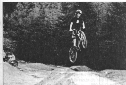
També es va fer celebrar una exhibició de Dirt Jump (L'ABM)

La Caminada a la llum de la lluna de Vallgorquina té uns 180 participants