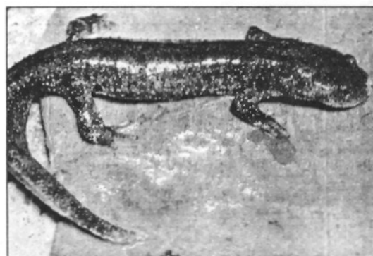
Una imatge del tritó del Montseny

Neixen cries en captivitat de tritó del Montseny per primera vegada