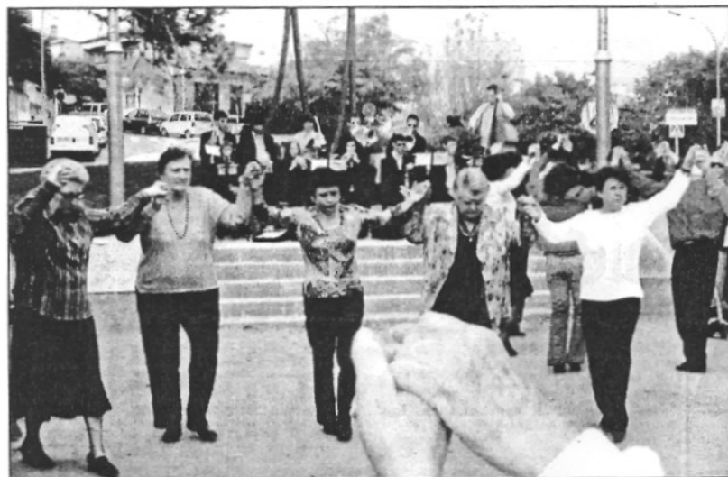
L'Agrupació Sardanista Baix Montseny celebra enguany el 30 aniversari (L'ÀMBM)

L'Associació considera que el fet que la Festa Major s'hagi desplaçat uns metres no respon a les reivindicacions que han posat sobre la taula. A més, segons un portaveu, consideren un contrasentit que d'una banda l'Ajuntament els faci costat davant els problemes de sorolls de l'Acampada Jove "i ara posin els concerts i les atraccions de la fira aquí". També temen que l'emplaçament es podria mantenir força temps perquè hi ha possibilitat que el desenvolupament del P16 vagi per llarg.