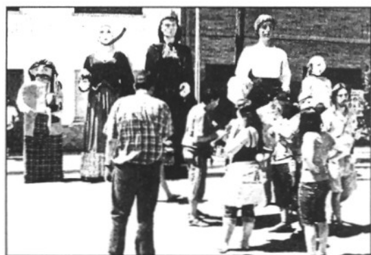
Els gegants del municipi seran presents a la Festa (L'ABIM)