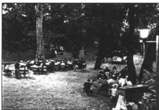
La Font de Montserrat serà l'escenari del concert (L'ABIM)

REDACCIÓ. Campins Campins ha organitzat, per aquest cap de setmana, una nova edició del Concert d'Estiu, una tradició que s'ha mantingut els últims anys per cadascuna de les estacions. En aquesta ocasió, el quartet de saxofons Katasax serà l'encarregat d'oferir un concert que se celebrarà a la Font de Montserrat, a l'aire lliure, a partir de les 9 del vespre.