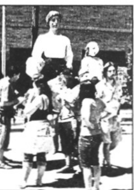
Els gegants del municipi seran presents a la Festa (L'ABIM)

bra de teatre 'Bravo, bravo, que bé que ho fan'.