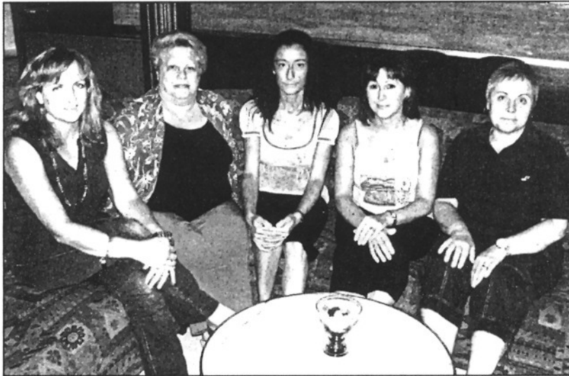
Algunes de les components de la nova Junta de l'entitat amb la presidenta, al centre

"Volem animar totes les dones a participar més activament", assenyalen des de l'entitat, que també vol posar-se en contacte i mantenir lligams amb associacions dels municipis de l'entorn que tinguin objectius comuns.