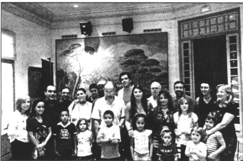
Imatge del dia de benvinguda dels infants sahrauís a Sant Celoni