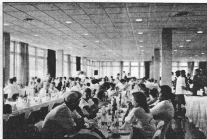
Dinar popular. Els actes van acabar amb un dinar de les 200 persones que, bé fent tot el trajecte, part d'aquest o rebent la Colla a Montserrat va participar d'aquesta fita. (L'ABM)