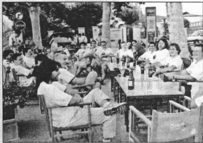
Relleus. Els 85 quilòmetres que van de Sant Celoni a Monistrol de Montserrat van fer que la Colla es plantegés fer 3 grups de persones que es rellevessin com a portadors dels gegants, entre els quals va aconseguir sumar fins a 45 persones voluntàries.