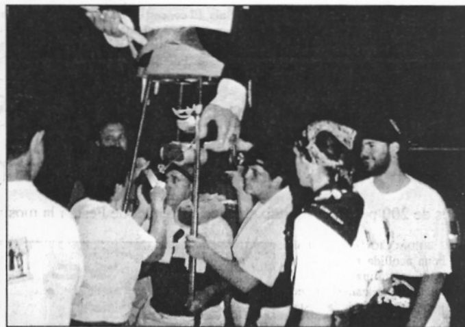
Caminant de nit. La major part del recorregut es va fer divendres a la nit, motiu pel qual els gegants es van equipar amb llums. La velocitat dels portadors va fer que la majoria de trams es fessin per sota del temps previst, arribant a Monistrol a les 9 del matí. (L'ABM)