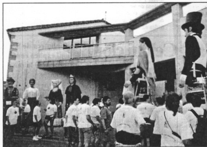
Acompanyament. Diverses colles geganteres van voler acompanyar un tram els gegants de Sant Celoni, com la de Vilafranca de Conflent. Altres, com les de Sant Pere i Sant Antoni de Vilamajor van esperar el pas de la colla amb els seus propis gegants. (L'ABM)