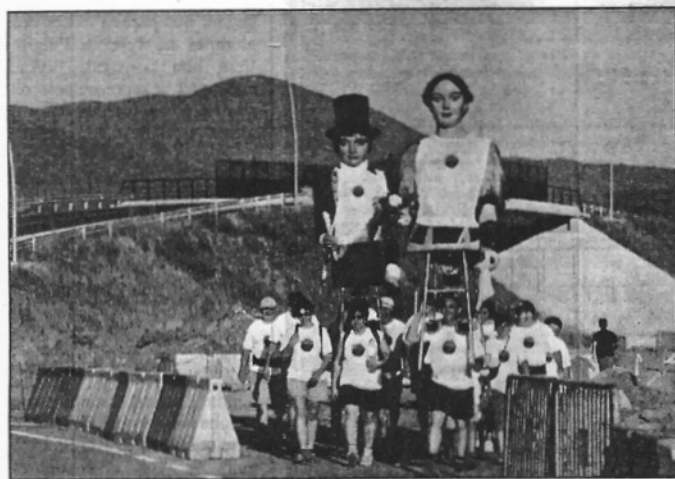
Punt de partida Sant Celoni. El Martí i la Maria del Puig, els dos gegants de Sant Celoni van emprendre dissabte la ruta que els portaria a peu a Montserrat. La Colla de geganteres va sortir a dos quarts de 8 del vespre de la plaça de la Vila en direcció a Palau.

Fins a 45 portadors en tres relleus van participar a una fita històrica recorrent un trajecte de gairebé un centenar de quilòmetres