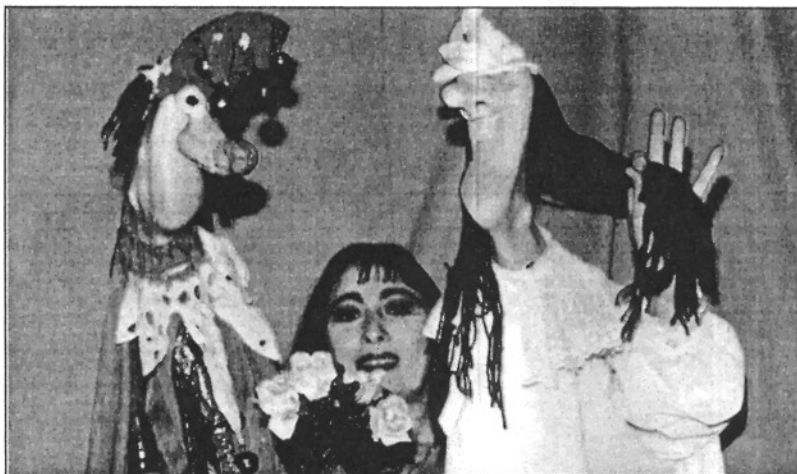
Una imatge de les titelles que Laura Kibel realitza a partir dels seus peus (L'ADBM)

REDACCIÓ. Sant Celoni El cicle de 'Dijous a la fresca' organitzat des de l'àrea de Cultura de l'Ajuntament de Sant Celoni porta, el proper dijous 12 de juliol, un fascinant espectacle de l'artista italiana Laura Kibel, 'Teatro dei piedi' a la plaça de la Biblioteca a les 10 del vespre. La singularitat de l'obra se centra en els elements que utilitza per al seu espectacle: els seus peus, les seves cames