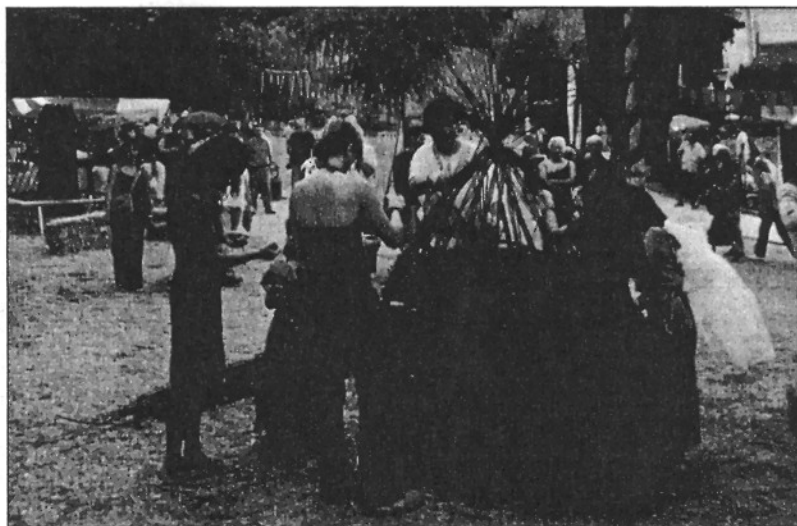
La Festa Major de Sant Pere va comptar amb una nodrida participació dels veïns