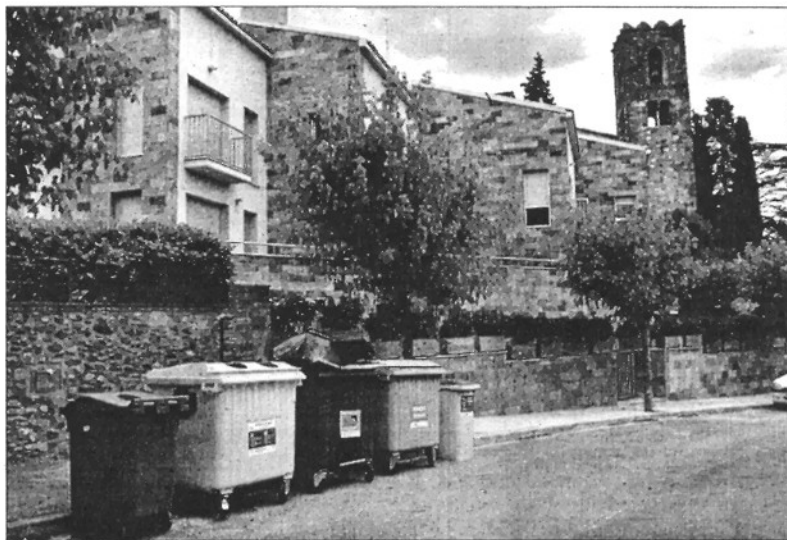
El municipi ha incrementat el nombre de contenidors a disposició dels residents en els últims mesos

Els punts de recollida s'han augmentat de 30 a 136. A cada punt de recollida hi haurà contenidors per a les cinc fraccions de rebuig, orgànica, paper i cartó, vidre i envasos. Al tríptic també s'inclou el quadre amb els deis de recollida de cada fracció, de restes vegetals i mobles. La recollida de restes vegetals es farà cada dilluns de dia. La recollida de volu-