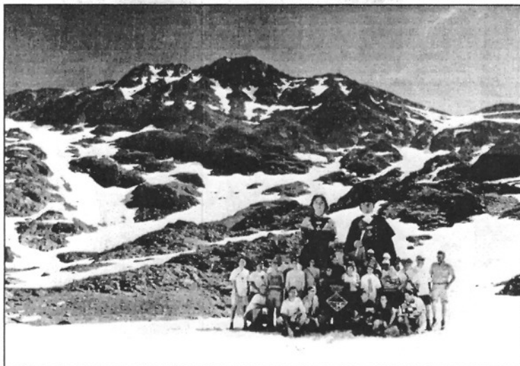
Els geganters de Sant Celoni ja han fet cims com la Pica d'Estats i el Canigó (L'AMB)

L'expedició es dividirà en tres grups que faran relleus cada 10 quilòmetres per portar els gegants. El 6 de juliol se sortirà de la plaça de la Vila direcció Santa Maria de Palautordera per enllaçar, per la drecera, amb Sant Antoni de Vilamajor en un recorregut nocturn. Diumenge, 8 de juliol, es farà