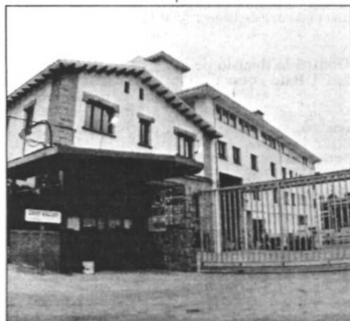
Cray Valley a Sant Celoni