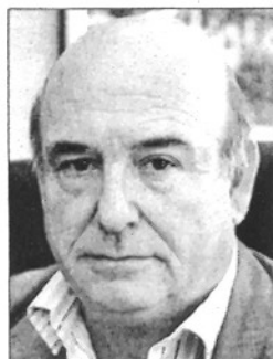
LLIÇA DE VALL

Viu a Lliça d'Amunt des de fa vuit anys. És llicenciat en empresarials per la Universitat de Barcelona i, fins ara, era responsable d'estudis econòmics de l'Ajuntament. Era la primera vegada que liderava la llista del PSC.