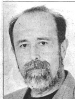
SANT A. DE VILAMAJOR

Té 46 anys, i en fa 17 que viu a la Roca. Va néixer a Barcelona, on va estudiar arquitectura superior a la UPC. Des de 1999 és cap de llista de CiU a la Roca, on el partit va governar de 1991 a 1995. És casat i té dos fills. Serà alcalde per primer cop.