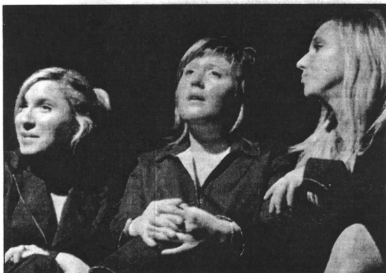
Una imatge de l'obra que Xcèntric Teatre representarà al Festival Internacional (L'ADBM)

al Festival l'obra 'Dits en joc' que ja ha estat reconeguda en certàmens de teatre