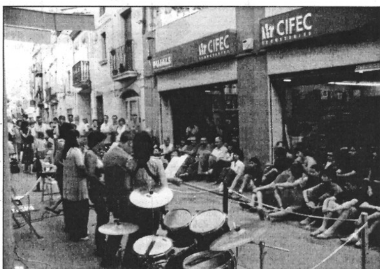
L'Escola de Música de Sant Celoni ja va protagonitzar una actuació a l'edició passada (L'ADBM)

activitats de tarda és atraure els veïns i visitants del municipi, buscant que la