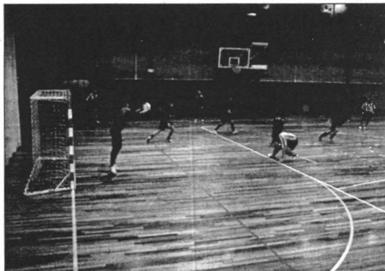
El FS Sant Celoni acomiada una temporada molt desafortunada (L'ÀRBM)

El Vilamajor juga el darrer partit sense possibilitats d'ascens