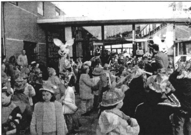
Una imatge de la festa de carnestoltes celebrada al CEIP La Tordera (L'AdBM)

A les 11 del matí de diumenge, s'obrirà l'espai de les entitats, que comptarà amb tallers, com el de tir amb arc o el de ping-pong, entre d'altres, jocs, danses, curses de scalèxtric i activitats adreçades al públic infantil.